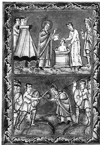
Der Heilige Bonifatius ist der in Deutschland bekannteste christliche Märtyrer, der wegen seiner missionarischen Tätigkeit getötet wurde.

Und im Übrigen: Wer gegen christliche Mission ist, muß auch - da sind manche islamischen Länder durchaus konsequent - jeden christlichen Gottesdienst verbieten, denn jeder Gottesdienst ist eine Einladung, Gottes Gnade anzunehmen. Er müßte auch jede christliche Erziehung im Elternhaus und in Jugendzentren ablehnen - das wußten die russischen Kommunisten nur zu gut.